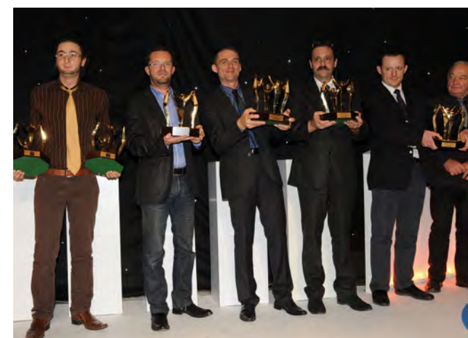
Soirée Trophées Placo® - Palais Brongniart Les 5 lauréats 2011

Evènement phare de toute une profession ; les Trophées Placo® 2011 ont été remis le jeudi 10 novembre, lors d'une soirée prestigieuse au Palais Brongniart à Paris en présence des architectes des projets nominés, des entreprises du Club Placo® et de nombreuses personnalités du monde de la construction.