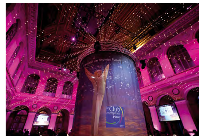
Soirée Trophées Placo® - Palais Brongniart

Les visiteurs du site www.placo.fr ont pu découvrir les ouvrages des lauréats des Challenges régionaux et voter en ligne pour élire le projet de leur choix.