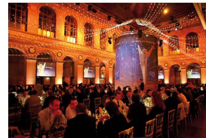
Soirée Trophées Placo® - Palais Brongniart - Le dîner

Evènement phare de toute une profession ; les Trophées Placo® 2011 ont été remis le jeudi 10 novembre, lors d'une soirée prestigieuse au Palais Brongniart à Paris en présence des architectes des projets nominés, des entreprises du Club Placo® et de nombreuses personnalités du monde de la construction.