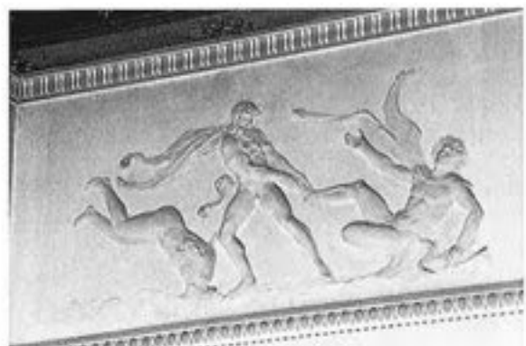
Via Mérysis, frise de la salle de la ville

Les travaux de rénovation de la galerie de Rodets, au Musée d'Orsay, ont été réalisés par l'entreprise de rénovation et de restauration de l'architecture, la Société OTS staff, et ateliers des ateliers en état. Les travaux de rénovation de la galerie de Rodets, au Musée d'Orsay, ont été réalisés par l'entreprise de rénovation et de restauration de l'architecture, la Société OTS staff, et ateliers des ateliers en état. Les travaux de rénovation de la galerie de Rodets, au Musée d'Orsay, ont été réalisés par l'entreprise de rénovation et de restauration de l'architecture, la Société OTS staff, et ateliers des ateliers en état.