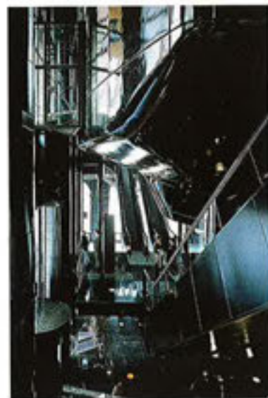
Céline en staff de l'Opéra de Lyon réalisée avec la générale Prestia des Frères Lefrigo, Jean Nouvel, arch

À la question "Qu'est-ce que le staff en plâtre?" l'architecte répond : "C'est une forme traditionnelle. Assurément, il s'agit d'un matériau qui n'est pas très moderne, mais il faut mettre des idées nouvelles dans les matériaux."