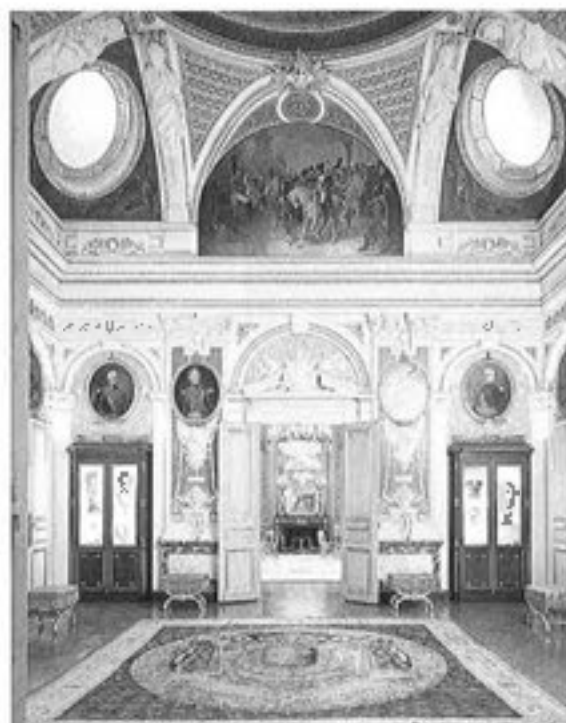
Hôtel de Saint-Anne de la Région d'Haute-Normandie, Paris Société OTS staff et de staff