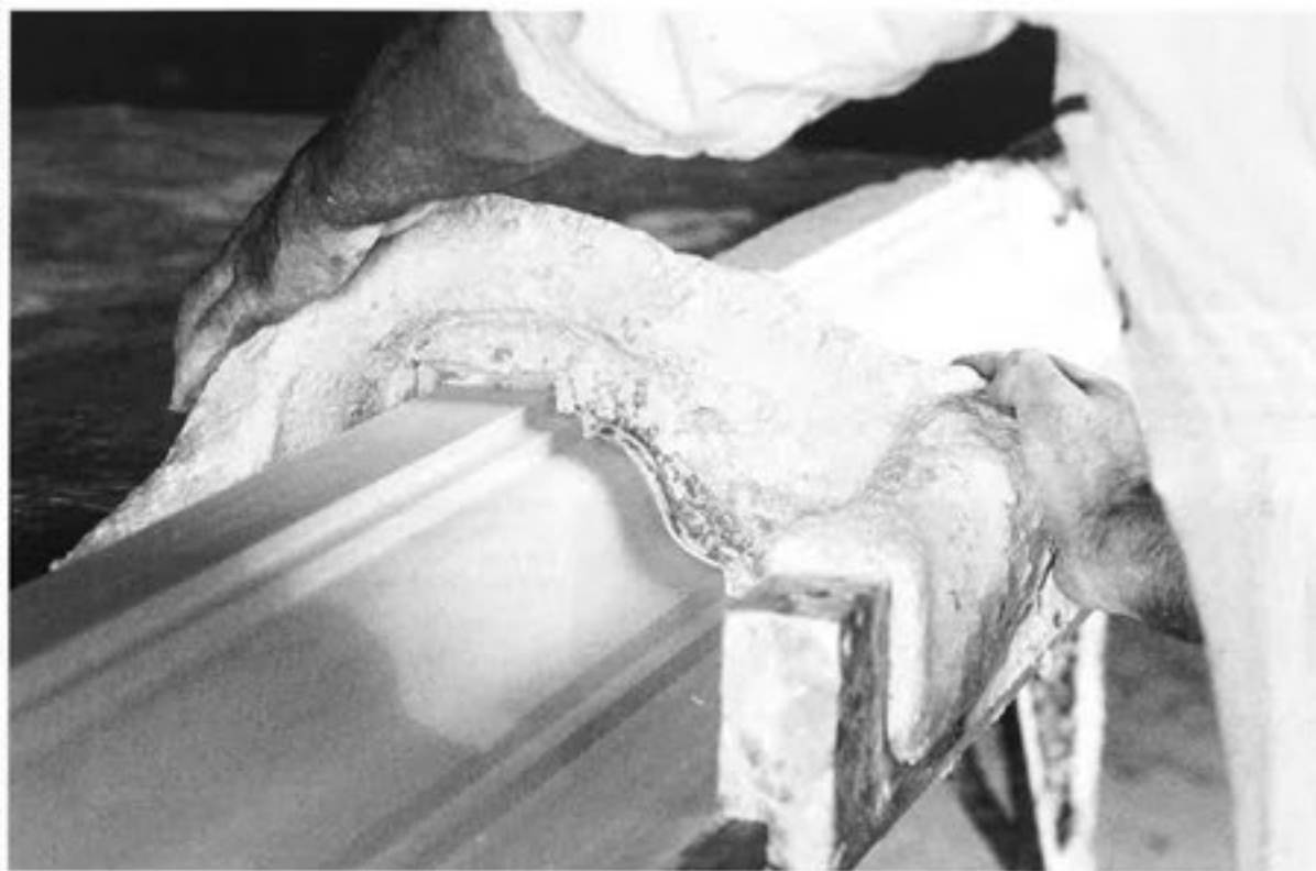
Quelques états du plâtre - arma, sur lequel le staffeur traîne un gabarit (P. J. Lambert)