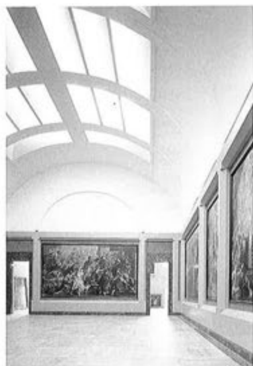
Galeries des Rodets. Louvre-Musée en état (S.D.E. Sluc & Staff, Société OTS staff, et ateliers des ateliers en état)